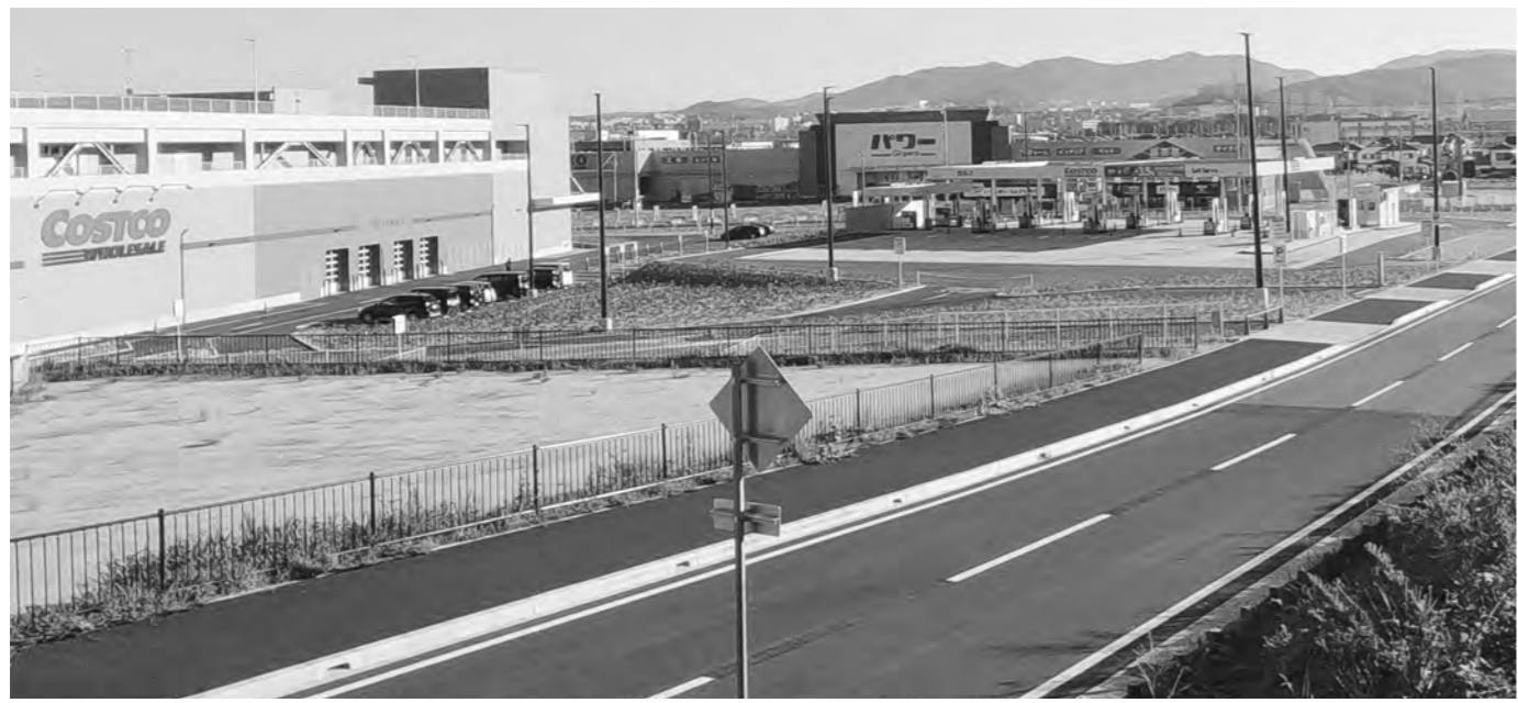
先行して整備された大型商業保留地。コメリ、コストコに続きCゾーンにはK・F・Cなどの飲食店が出店予定