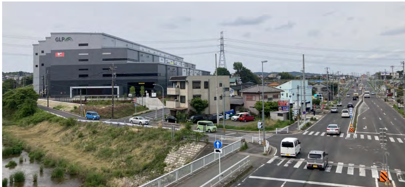
混雑が想定される野添橋交差点から見た GLP 新倉庫 (左奥)

◆編集・発行 志段味東学区連絡協議会 学区通信編集委員会 名古屋市守山区大字 中志段味字宮前 1175-1 志段味東コミュニティ センター内 TEL&FAX 052-736-4506