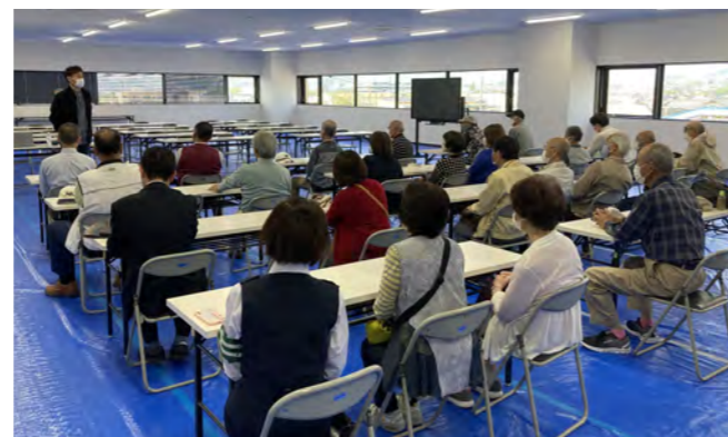
概要説明が行われたテナント用事務所スペース

当該倉庫は、敷地面積約7,865坪、延床面積は約13,007坪で地上4階建てとなっており、最大2テナントの入居が可能となってい